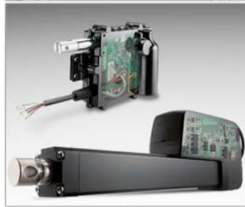
Die Entwicklung smarter Maschinen beginnt mit smarten Komponenten wie den industriellen Linearaktuatoren Electrak® Throttle und HD.

Thomson hilft dabei, die Intelligenz Ihrer linearen Antriebssysteme steigern, sodass Sie die Steuerbarkeit verbessern, Komplexität senken und Gesamtkosten minimieren . Die Technologie der industriellen linearen Aktorik hat sich dem Konzept von Industrie 4.0 angepasst und damit: